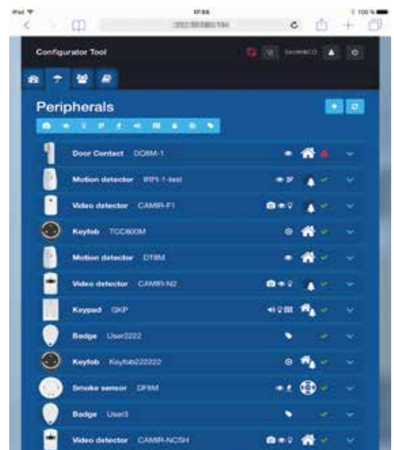
Total Connect Pro Manager en el iPad: Lista de periféricos