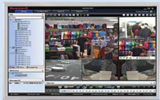
VISUALIZAÇÃO MAXPRO 1+5

Entre em contato conosco hoje para mais informações sobre como O MAXPRO VMS pode ajudá-lo a agilizar o seu vídeo de segurança e tornar suas operações mais eficientes.