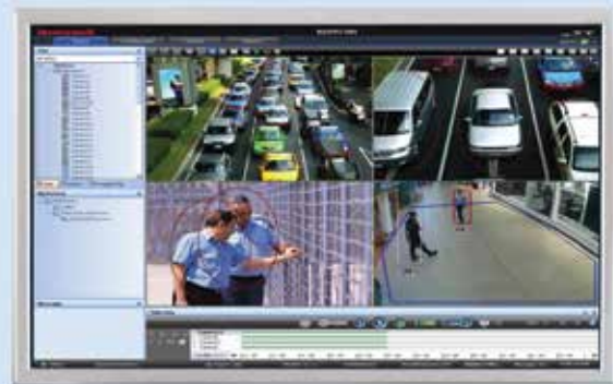
VISUALIZAÇÃO MAXPRO 2x2