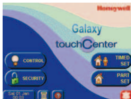
Pantalla de inicio estándar