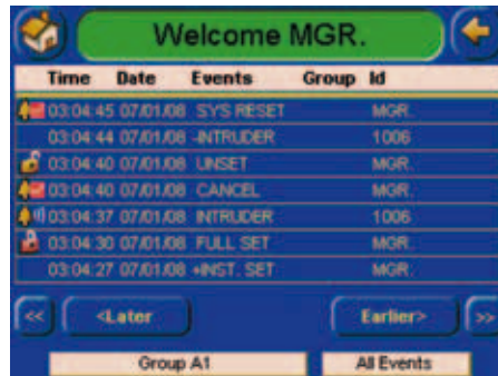
Registro de eventos

Códigos, TAGs o tarjetas de proximidad para armado y desarmado rápidos y seguros