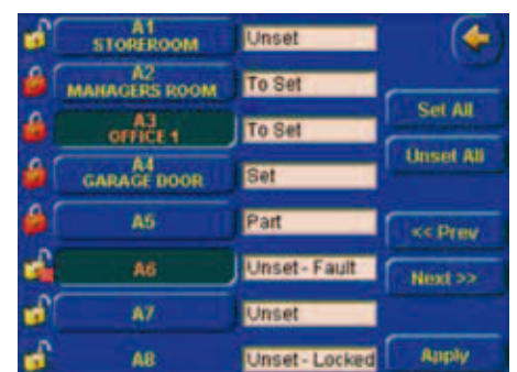
Estado de armado de los grupos