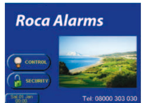
Personalización del instalador