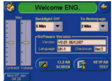
Configuración del sistema