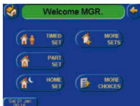
Pantalla de armado