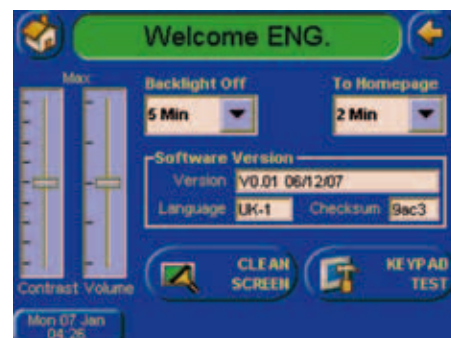
Impostazione del sistema