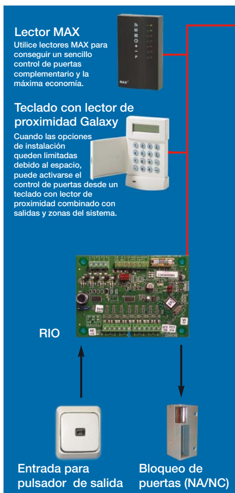
Diagrama de configuración