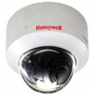
Montage op een vlakke ondergrond