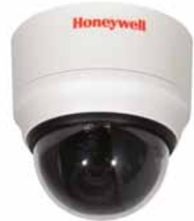
Modelo HD3MWIHX con anillo para montaje en superficie