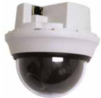
Modelo HD3MWIHX sin anillo para montaje empotrado