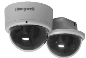
HD3CX met montage ring voor montage op een oppervlak