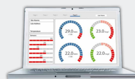
Saia PCD Supervisor

Saia PCD Supervisor EM de SBC est un module d'extension pour la plateforme de supervision qui vous donne une plus grande maîtrise des performances environnementales et des coûts d'un bâtiment.