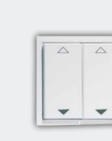
EasyClick (Eclairage & ombrage)