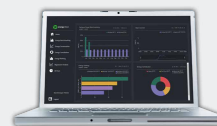
Saia PCD Supervisor EM