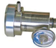
Automatische debietregelaar (DFR)