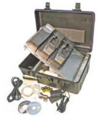
Draagbare MicroDock II systeemkit