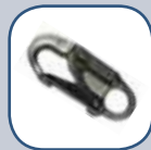
Porte-mousqueton à verrouillage Ouverture de 19,1 mm (3/4 po)