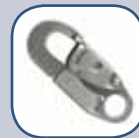
ANSI Z359 Porte-mousqueton à verrouillage Ouverture de 19,1 mm (3/4 po)

Utilisez cet équipement uniquement après avoir lu les instructions du fabricant. Le non-respect des instructions peut causer des blessures graves, voire mortelles.