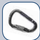
Mousqueton à verrouillage automatique en aluminium Ouverture de 25,4 mm (1 po)