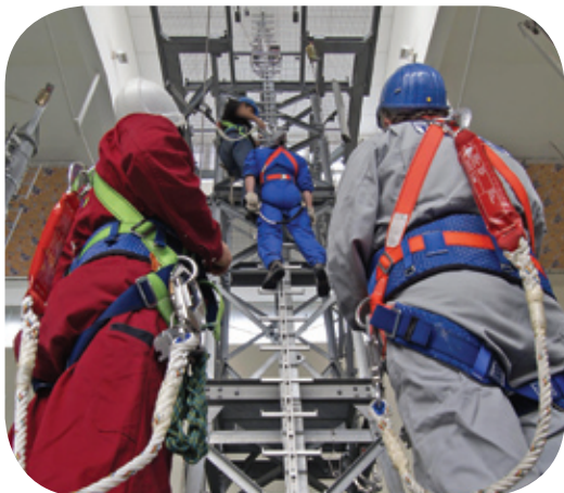
Miller by Sperian tillhandahåller en fullständig lösning för räddning och evakuering.

Miller by Sperian erbjuder standardkurser eller skraddarsydd kurs, inklusive teori och praktik. Utbildning kan tillhandahållas över hela världen på våra kurscenter eller på plats.