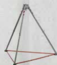
2,50 m con cinghia a rete