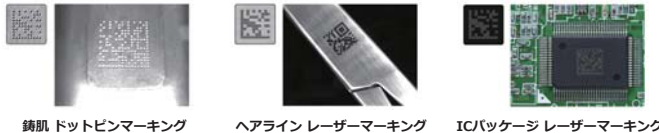
鋼肌 ドットピンマーキング