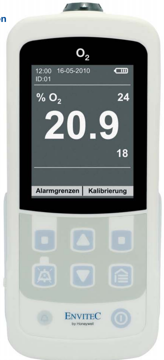
Gerät in Originalgröße